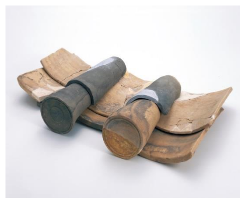
33次調査で出土した かわら 瓦の復元