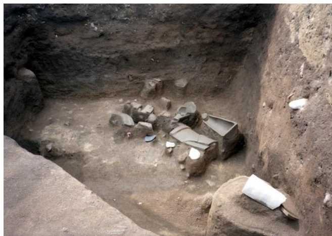
正倉院区画溝内での かわら 瓦出土状況(33次調査地点)

今回の調査は しょうそういんくかくみぞ 正倉院区画溝より内側、つまり正倉院内において行っており、瓦片もその範囲内から出土しています。今までの調査でも、瓦片は正倉院区画溝内を中心に正倉院内から多く出土しています。このことから、正倉院内に かわらぶき 瓦葺の建物があった可能性を想定することができ、現在その痕跡も探しています。