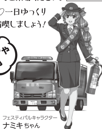
フェスティバルキャラクター ナミキちゃん