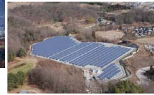
■メガソーラーいいだ(H23年1月運転)