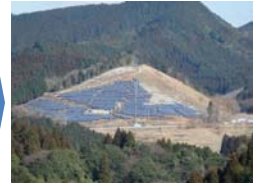
※ http://mizumasari-solapark.com より転載