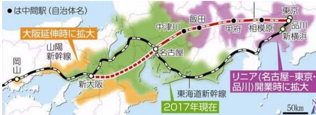
リニア中央新幹線で結ばれる人口約7000万人の地域「スーパー・メガリージョン」

リニア飯田駅の想定乗降客数 6,800人 本当にこんなに乗り降りするの?? 今から何か準備しないと