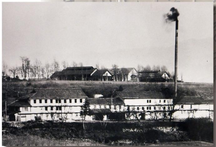
上郷村組合製糸上郷館