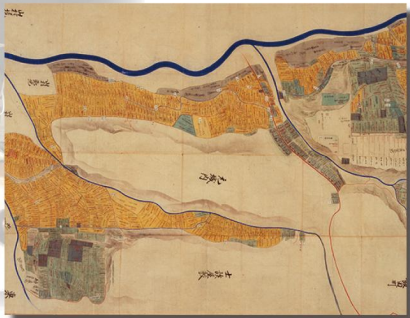
信濃国伊那郡上飯田村田畑山林引絵図(明治初期)