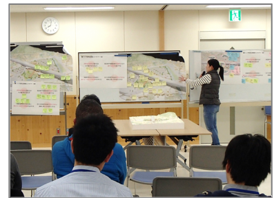
■代表者による発表の様子