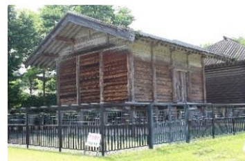
建物復元展示の例：中宿遺跡

復元展示を行う正倉以外の建物跡や正倉院の外周区画溝などの遺構については、最も様相が明瞭な時期の施設の配置や規模などが分かるように、発掘調査で確認した位置の地表面に立体的な表示を行います。