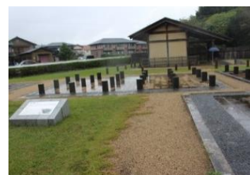
建物表示整備の例：志太郡衙跡