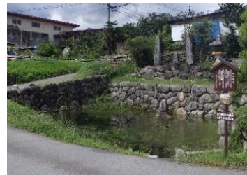
水を湛えた恒川清水の姿の整備

清水のある地区は「清水整備ゾーン」として、石垣で囲まれ水を湛えた清水として長年受け継がれてきた恒川清水の姿に整備します。また、清水の前面地区は「緑地ゾーン」として、清水と調和した景観を形成し、清水を眺める緑地空間として活用できるよう整備を行います。