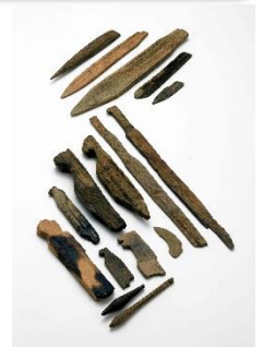
恒川清水付近出土 木製祭祀具