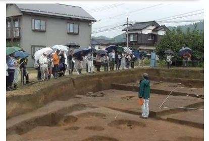
発掘調査の現地見学会