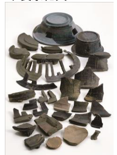
恒川遺跡群出土硯 (市指定有形文化財)