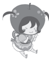
結いターンキャリアデザイン室 イメージキャラクター 「ゆいたん」