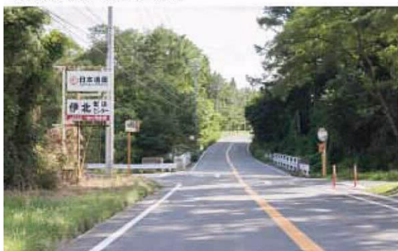
広域農道駒ヶ根方面_現状