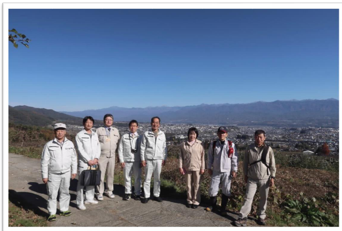
【伊賀良北方地区から眺めた南アルプス】