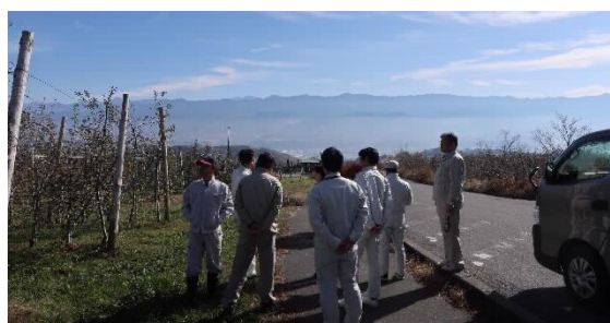
【委員会の現地調査の様子】