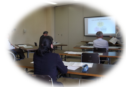
事業所支援集団セミナー