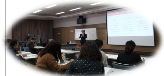
市民向けワーク・ライフ・バランスセミナー