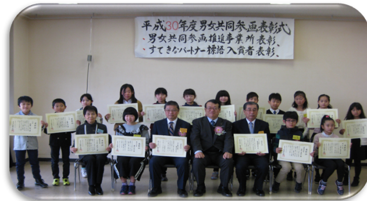
男女共同参画事業者及び「素敵なパートナー女と男」表彰式