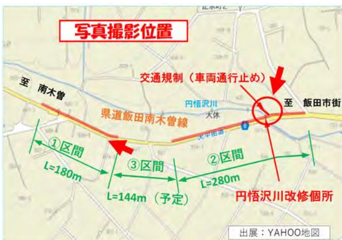
道路拡幅整備計画