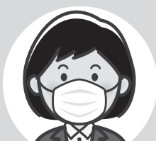
咳がでる人はマスクを着ける