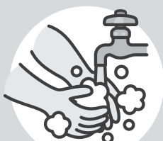
こまめに手を洗う