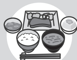
よく眠り、バランスよく食べる