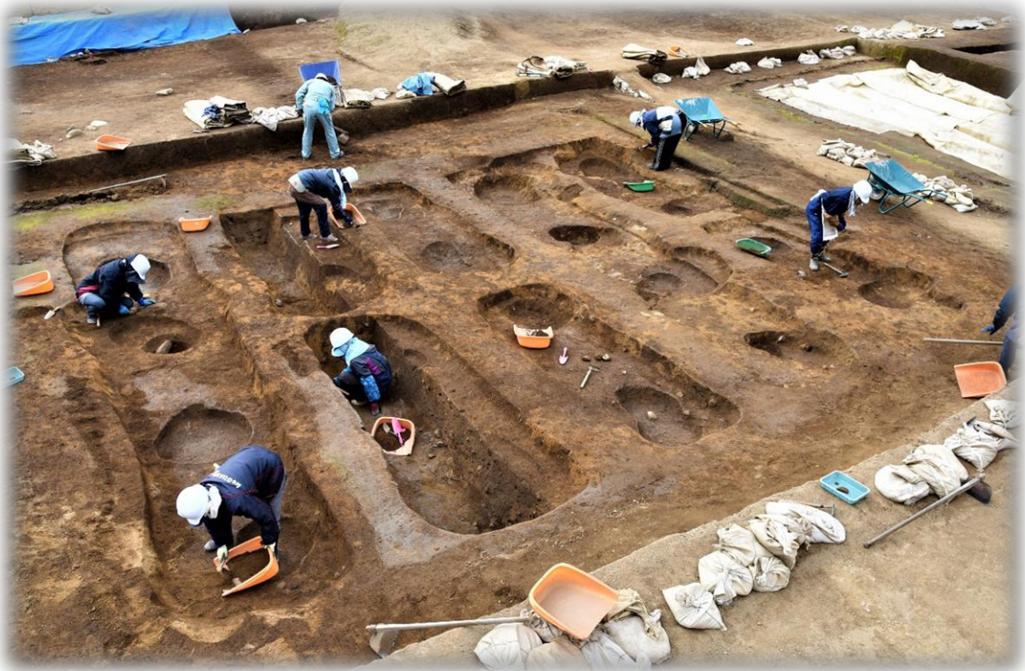
掘立柱の正倉（ST05）の調査 102次調査