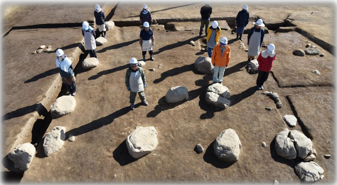
礎石建ちの正倉（SB001） 102次調査