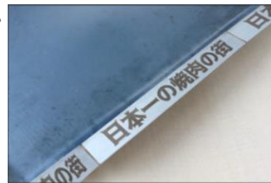
※記念名入れ刻印【大】イメージ