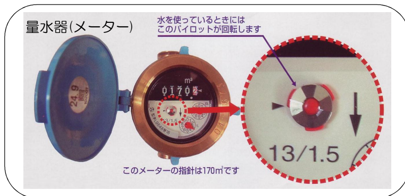
一般の家庭でもっとも多く使われている口径13ミリの水道の量水器（メーター）です。ふたを開けると、指針が数字で表示されています。この水量を表す数字の単位は立方メートル(m 3 )です。