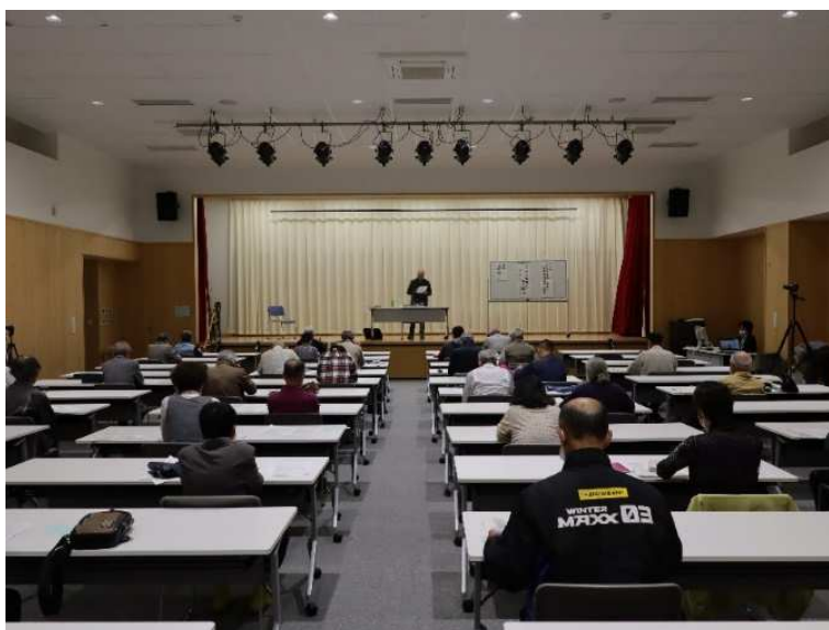
飯田アカデミア 10/16～17 開講「二. 二六事件とその時代」スナップ