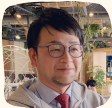
有限責任監査法人トーマツ 佐藤