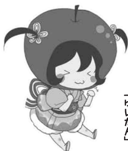
イメージキャラクター 「ゆいたん」