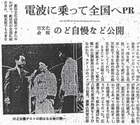
南信州新聞 昭和47(1972)年5月8日