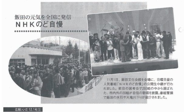
広報いいだ 平成10(1998)年12月1日号