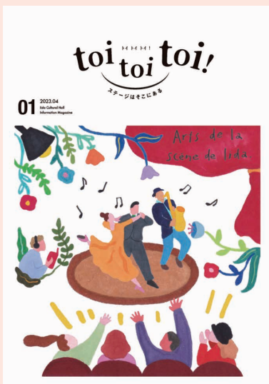
B5 版カラー・16 ページ

飯田文化会館では、情報誌の制作や広報活動にご協力いただける方も募集しています。ご興味のある方は、お気軽にお問い合わせください。