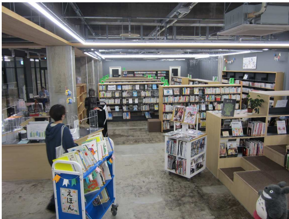
中央図書館飯田駅前分室（飯田駅前図書館）

令和4年5月19日高校生や若い世代が気軽に本に親しむ機会をつくることを目的に、「ムトスぷらざ」3階にオープン。