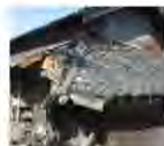
緊急代執行を要する 崩落しかけた屋根