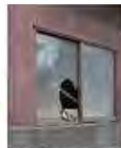
窓が割れた 管理不全空家