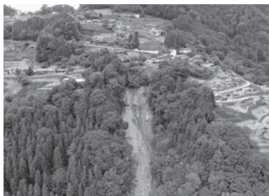
被害を受けた上村下栗地区の様子