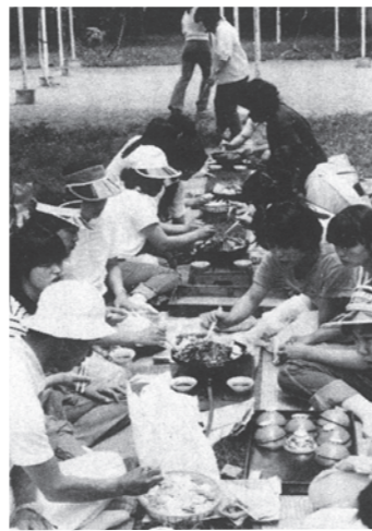
ジンギスカン鍋で焼肉をする様子 S52~S56年に池田真佐子様撮影「風越の灯」より （飯田市立中央図書館 所蔵）

うちの看板商品は牛肉。日本一の焼肉の街って言われるようになってから、県外からのお客さんも増えてありがたいね。信頼できる生産者から「頭買いにこだわって仕入れているから質の良い肉が都会より安く手に入るし、扱う部位も多くて地元の人にも