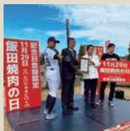
「飯田焼肉の日」記念日登録