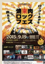
焼肉肉ロックフェス2015ポスター（第1回）

焼肉肉ロックフェス誕生 音楽と焼肉の祭典・第1回焼肉肉ロックフェス開催（飯田人形劇場）。