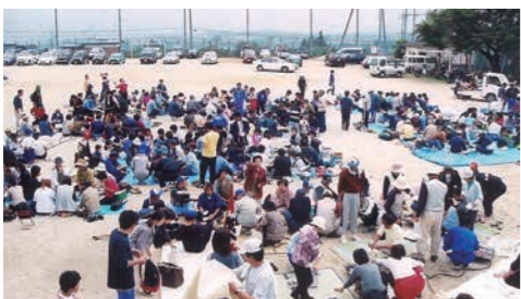
第1回羽場地区ふれあいスポーツ祭打ち上げ焼肉大会の様子（平成13年10月8日撮影 羽場公民館提供）

「お客さんの声を受けて、いくつかの肉屋がサービスで始めたのが昭和50年代初頃くらいから。当時、家での焼肉といえばジンギスカン鍋が主流だったけど、大勢で食べるには鉄板とガスで焼くのが調子良かったんだらうね。うちも開店早々に鉄工所で鉄板を作ってもらって、今は20枚くらい貸し出し用として提供してる。商売につながるっていう気持ちもあったけど、一番は「やったら面白いな」と思ったのがきっかけだね。