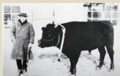
昭和10年（1935年）飯田・下伊那へ最初に貸しつけられた種牡牛「勇号」牛のあゆみも50年より