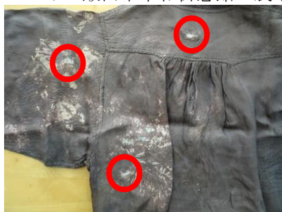
爆弾片が貫通した銀行服