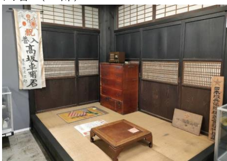
戦時下の暮らしを再現