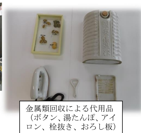
金属類回収による代用品 (ボタン、湯たんぼ、アイロン、栓抜き、おろし板)