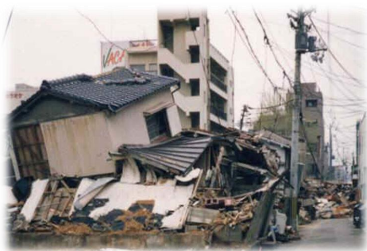
阪神・淡路大震災の死者の死因