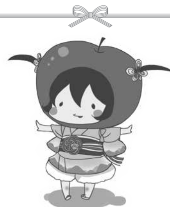
イメージキャラクター「ゆいたん」