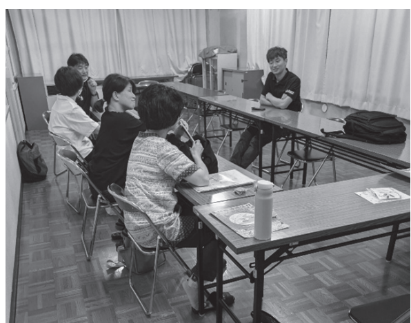
川路公民館での親の会