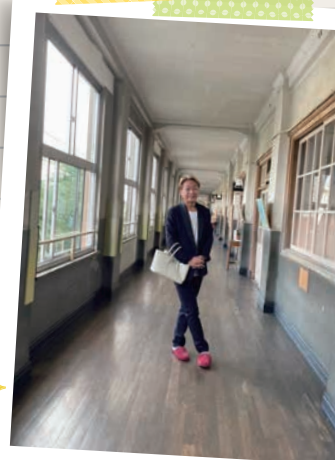
母校の追手町小学校にて