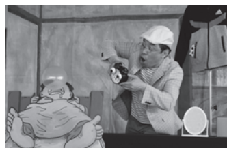
シアター奇望堂 「起きろ!」

申し込み・問い合わせ／●NPO法人いいだ人形劇センター ☎050(3583)3594 ●飯田文化会館 ☎0265(23)3552