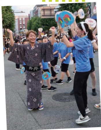
飯田まつり 飯田りんごん