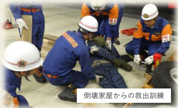
倒壊家屋からの救出訓練

有事の際、適切かつ有効な活動が展開できるよう、災害現場で共同する消防署との合同訓練をとおり、基礎的な知識、技術及び動きを学びました。基本あつての応用です。