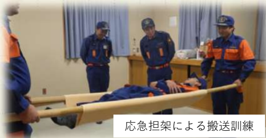
応急担架による搬送訓練