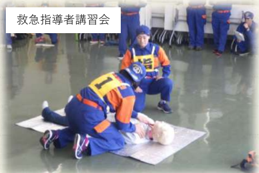
救急指導者講習会