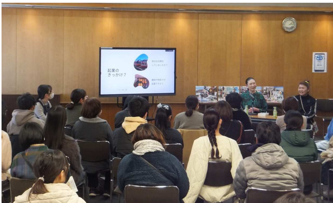
図 書 館