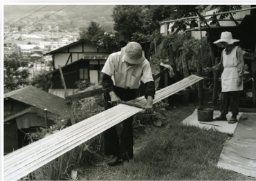
水引作りの様子（昭和52年、箕瀬町）