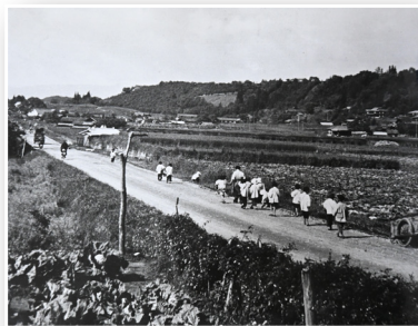
国道153号線の風景（昭和31年頃、上郷飯沼）