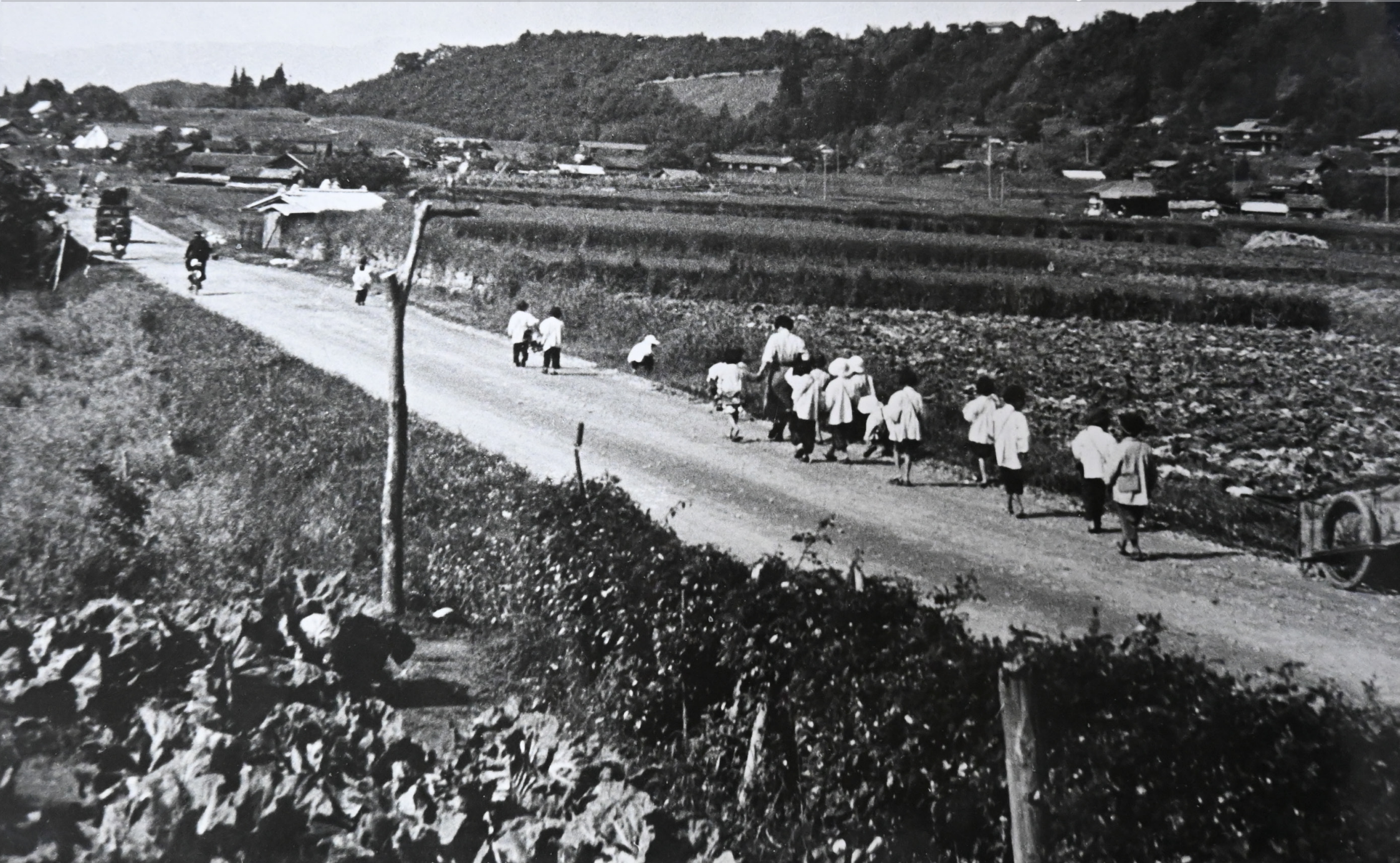
昭和31年頃 上郷飯沼 国道153号線の風景