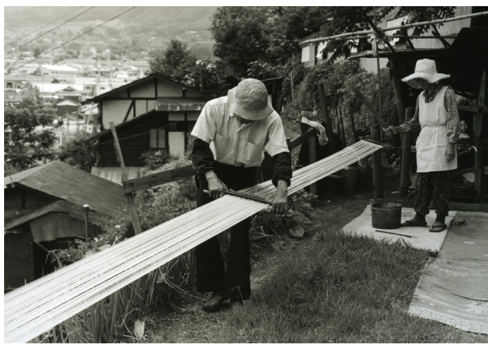
昭和52年 箕瀬町 水引作りの様子