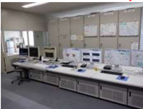
水処理監視制御設備