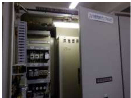
汚水ポンプVVFV盤設備