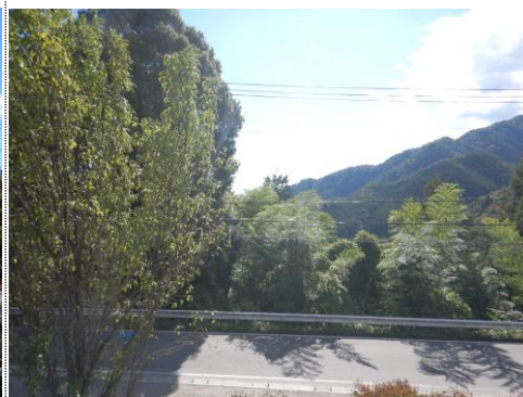
測定車から南風景