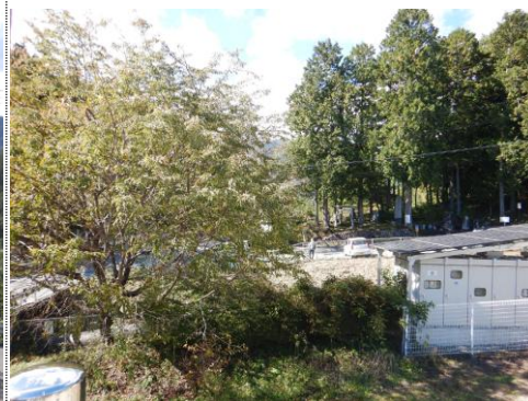
測定車から西風景