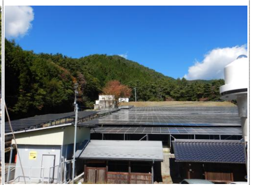
測定車から北風景