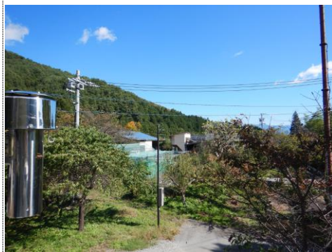
測定車から東風景