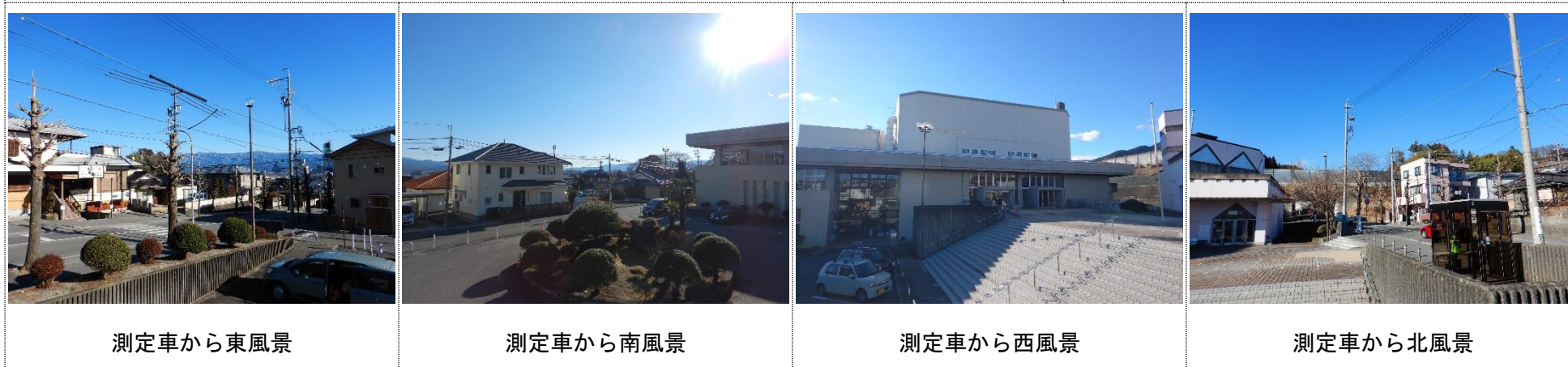
測定車から東風景