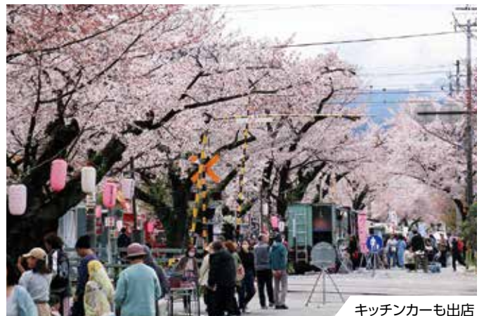
キッチンカーも出店

大宮諏訪神社から続く大宮通りには、ソメイヨシノなど129本の桜が植えられています。4月5日に開催された桜まつりでは、和太鼓演奏やバンド演奏、写生大会などが行われ約1万人が楽しみました。