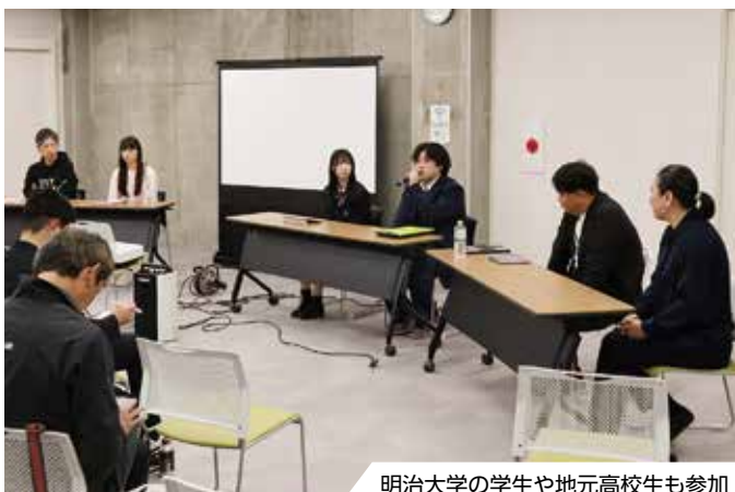
明治大学の学生や地元高校生も参加

信州大学大学院ランドスケープ・プランニング共同研究講座では、飯田下伊那地域の景観や空間のデザインを研究しています。3月に市民向けのオープンゼミを開講し、飯田の未来について議論しました。