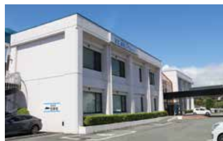
飯田コアカレッジ