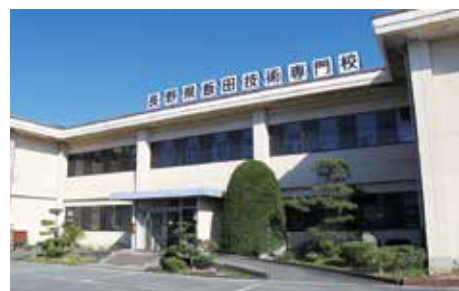
長野県飯田技術専門校