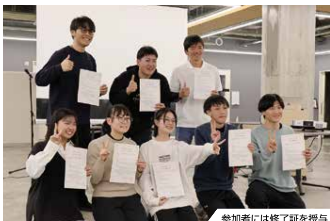
参加者には修了証を授与

昨年11月に高校生らが宮城県石巻市などを訪問し、震災復興や地域自治を学びました。