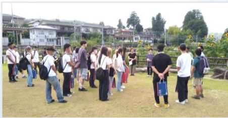
農家民泊、農家の皆さんとの対面式