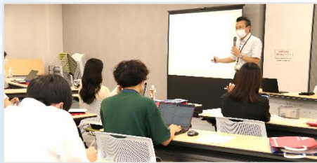
市長から直接、想いや考えを聞く講義