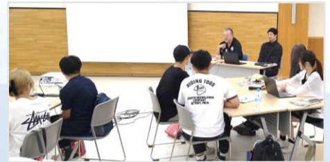
地域づくりの実践者との意見交換