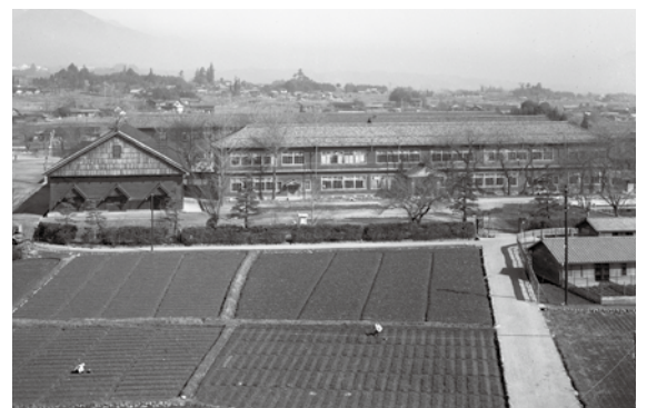
松尾小学校(昭和34年頃)