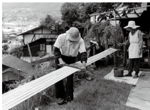
水引作り 箕瀬町(昭和52年頃)

戦後の地域の歴史も、記憶から失われつつあります。写真や聞き取りという形で記録を残し、保存していく試みを今後も続けていきたいと思っております。