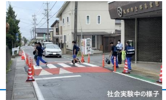
社会実験中の様子