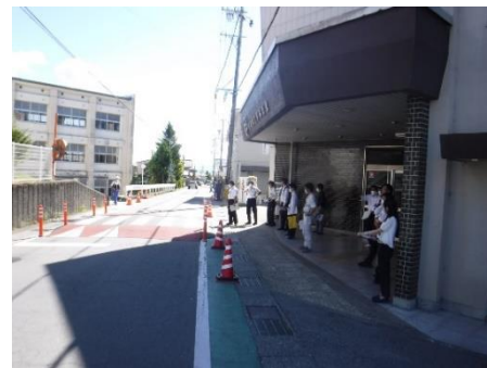
上郷地区ゾーン30プラス協議会の様子