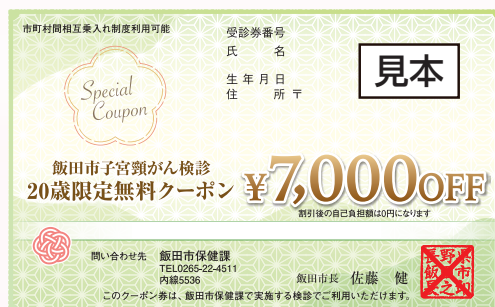
無料クーポン券 見本

20歳（平成17年度生まれ）の女性限定で、自治体から無料クーポン券が発行されます。飯田市では通常約7,000円かかる検診が、無料で受けられます。クーポンは5月頃に郵送予定です。市外に住所のある方は各自治体へご確認ください。