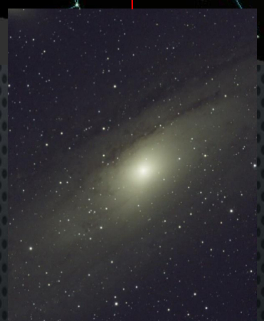
アンドロメダ銀河