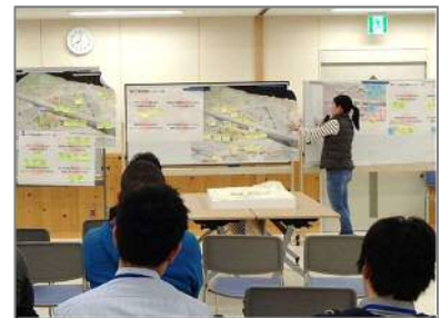
■代表者による発表の様子